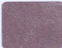
SFL 18 šedá