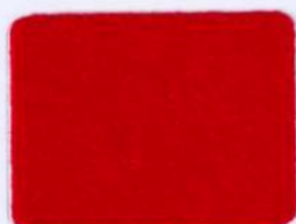
SFL 15 červená