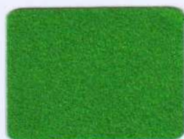
SFL 14 zelená