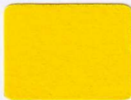
SFL 17 citrónovo žltá