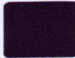
SFL 16 čierna