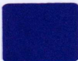
SFL 12 kráľovská modrá