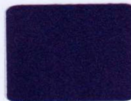
SFL 13 národná modrá