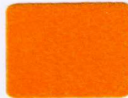
SFL 11 žltá