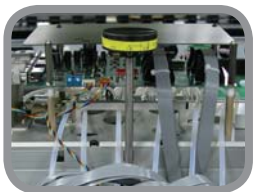
Nastaviteľná výška hláv (len VTIV-98P)